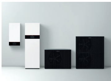
Vitocal 250-A Innen- (IDU) und Außeneinheiten (ODU) mit einer Nenn-Wärmeleistung von 2,1 bis 18,5 kW

Die Berechnungen der Stiftung Warentest für einen Modell-Altbau mit einem jährlichen Heizenergiebedarf von 21.000 kWh ergeben einen Stromverbrauch von etwa 6000 kWh pro Jahr. Bei einem angenommenen Strompreis von rund