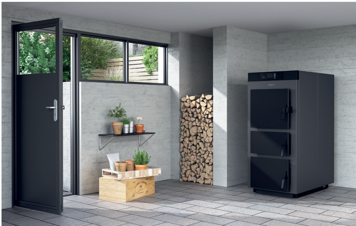
Vitoligno 200-S Hochleistungs-Holzvergaserkessel, 20 bis 50 kW

Hochwertiger Holzvergaserkessel für Scheitholz bis 50 cm Länge