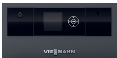
Regelung Ecotronic 100 mit beleuchtetem Display für einfache und intuitive Bedienung