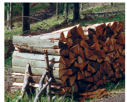
Heizen mit Holz – der natürlichste Brennstoff der Welt

Der kompakte Scheitholzkessel ist auch eine hervorragende Wärmeergänzung von bestehenden Öl- oder Gas-Heizungsanlagen. Dann übernimmt er im bivalenten Betrieb die Grundversorgung mit Heizwärme und Warmwasser. Erst bei extrem niedrigen Außentemperaturen wird der konventionelle Heizkessel zur Abdeckung der benötigten Spitzenlast zugeschaltet.