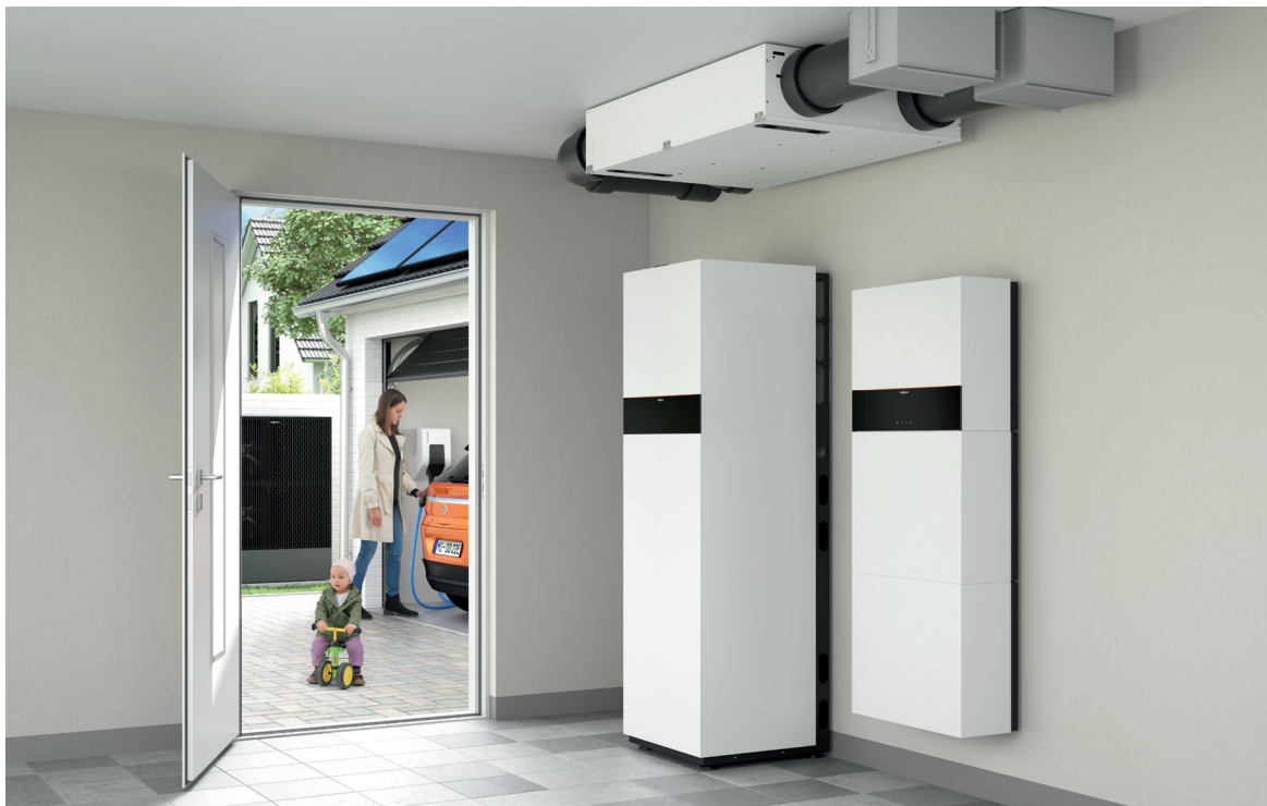
Wohnungslüftungs-System Vitoair FS mit Luft/Wasser-Wärmepumpe Vitocal 252-A und Stromspeicher-System Vitocharge VX3

Wohnungslüftungsgerät mit Wärme- und Feuchterückgewinnung