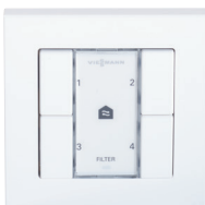
4-Stufen-Taster mit Filterwechsel-anzeige