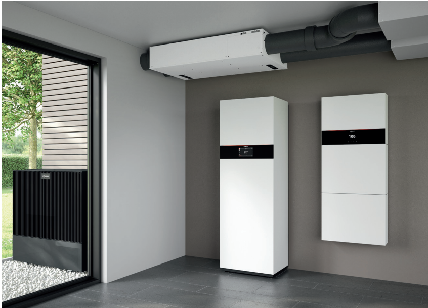
Wohnungslüftungs-System Vitoair FS mit Luft/Wasser-Wärmepumpe Vitocal 252-A und Stromspeicher-System Vitocharge VX3