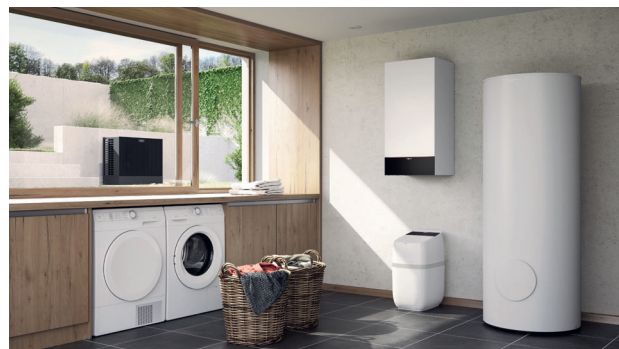
Luft/Wasser-Wärmepumpen Vitocal 200-S mit untergestellter Trinkwasser-Enthärtungsanlage Vitaset Aqua