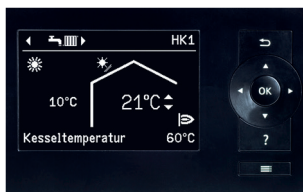
Display der Vitotronic Regelung mit Klartextanzeige und übersichtlicher Menüführung

Mit Vitoconnect und einem Smartphone ist die Bedienung von Viessmann Heizungsanlagen ein Kinderspiel. Mit der ViCare App können Heizungsanlagen gesteuert werden. Alle Apps sind für mobile Endgeräte mit iOS- oder Android-Betriebssystemen erhältlich.