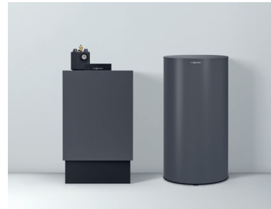
Vitoladens 300-C mit nebengestelltem Speicher-Wassererwärmer Vitocell 300-V (Typ EVIB-A, 200-l-Speichereinheit) - beide in der Farbe Vitographite

Zu einer modernen Heizungsanlage gehört auch innovative Solartechnik zur Nutzung kostenloser Sonnenenergie. Viessmann bietet dafür ein auf den Vitoladens 300-C abgestimmtes System.