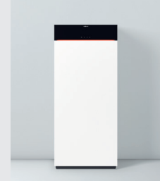
Vitodens 222-F Typ B2TH