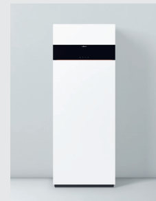
Vitodens 222-F Typ B2SH

1) Die System-Energieeffizienzklasse Heizung (Verbund) beträgt A innerhalb eines Spektrums von G bis A +++ .