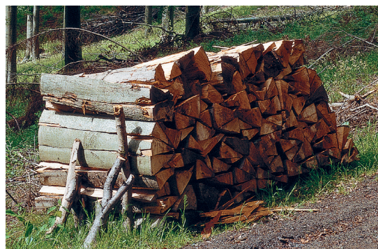
Heizen mit Scheitholz

Für einen hohen Heizkomfort kann das Zünden des Brennstoffes auch mittels einer optional erhältlichen automatischen Zündung mit einer Leistungsaufnahme von lediglich 300 W erfolgen. Auch kann der Kessel bereits mit Scheitholz wieder gefüllt werden, wenn noch keine Wärmeanforderung anliegt. Sobald die Temperatur des Heizwasser-Pufferspeichers für das Heizen oder die Warmwasserbereitung nicht mehr ausreicht, zündet der Kessel automatisch. Durch die geringe Leistungsaufnahme ist die Zündung besonders effizient.