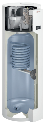
Warmwasser-Wärmepumpe Vitocal 262-A