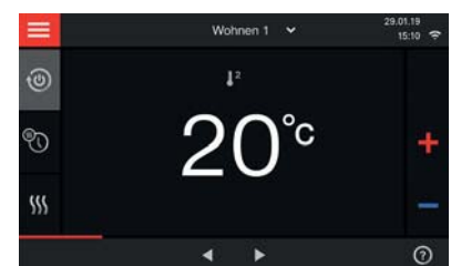
Das neue 7-Zoll-Farb-Touch-Display in Glasoptik

Touch-Display ganz einfach und intuitiv bedienen. Klartext- und Grafikanzeige führen durch alle Menü-Punkte. Und mit dem Energie-Cockpit hat man alle Energieverbräuche im Blick.