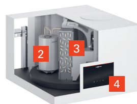
Vitocal 262-A Typ T2W-R290

Hybridvariante mit Wärmetauscher für den Einsatz in Öl-, Gas-, Biomasse- und Fernwärme-Heizungen