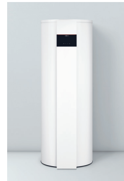
Vitocal 262-A Typen T2E-R290/T2H-R290