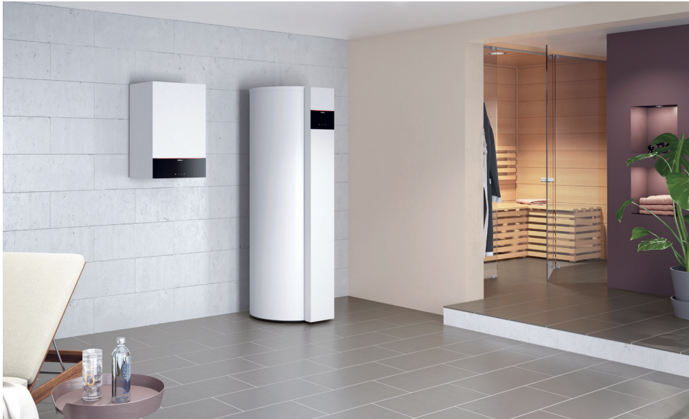
Warmwasser-Wärmepumpe Vitocal 262-A mit Gas-Brennwert-Wandgerät Vitodens 200-W

Die Warmwasser-Wärmepumpe Vitocal 262-A verwendet kostengünstig und energiesparend die Wärme der Raum-, Außen- oder Abluft zur Trinkwassererwärmung.