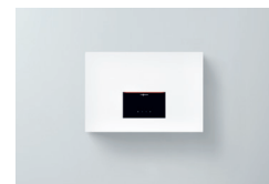
Vitocal 262-A Wandmodul Typ T2W-R290