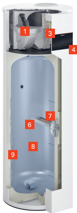
Vitocal 262-A Typ T2E-R290

Elektrovariante mit Elektro-Heizeinsatz für Elektrospeicher-Austausch oder Parallelbetrieb mit Heizungs-Wärmepumpe