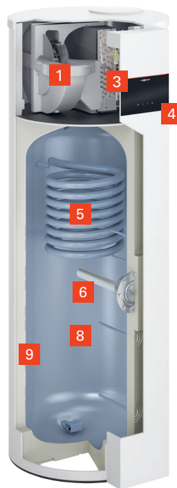
Vitocal 262-A Typ T2H-R290

Elektrovariante mit Elektro-Heizeinsatz für Elektrospeicher-Austausch oder Parallelbetrieb mit Heizungs-Wärmepumpe