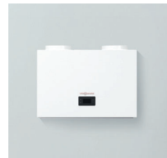
Vitocal 262-A Wandmodul Typ T2W-ze