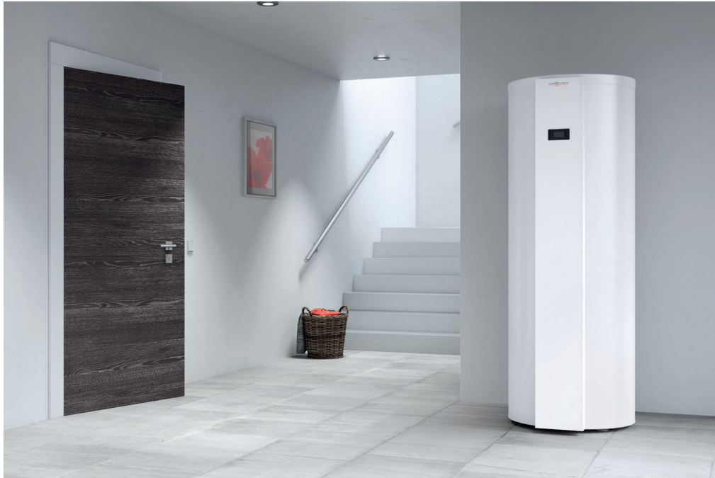
Warmwasser-Wärmepumpe Vitocal 262-A

Die Warmwasser-Wärmepumpe Vitocal 262-A verwendet kostengünstig und energiesparend die Wärme der Raum-, Außen- oder Abluft zur Trinkwassererwärmung.