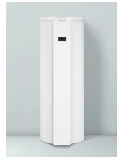
Vitocal 262-A Typen T2E-ze/T2H-ze