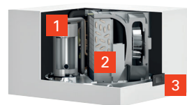
Vitocal 262-A Typ T2W-ze