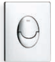
38 505 000 Skate Air Abdeckplatte ●