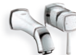
19 929 000 + 23 319 000 2-Loch-Waschtischbatterie Wandmontage Ausladung 177 mm ● ● 19 930 000 + 23 319 000 Ausladung 234 mm ● ●