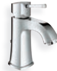
23 303 000 Einhand-Waschtischbatterie ● ● 23 310 000 glatter Körper ● ●