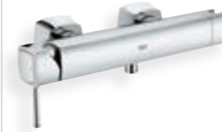
23 316 000 Einhand-Brausebatterie ● ●