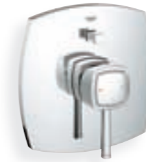
19 920 000 + 35 501 000 Einhand-Wannenbatterie ● ●