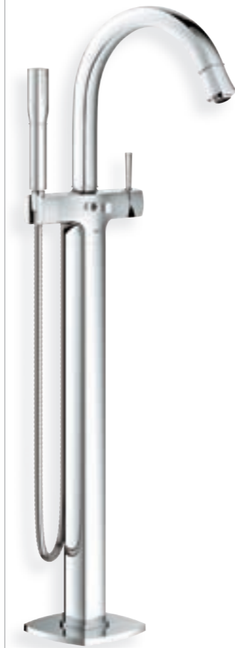
23 318 000 + 45 984 000 Einhand-Wannenbatterie Bodenmontage ● ●