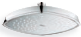
27 974 000 Kopfbrause 210 mm Strahlart Rain ● ●