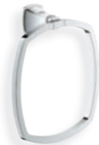
40 630 000 Handtuchring ● ●