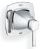
19 942 000 + 29 708 000 5-Wege-Umstellung ● ●