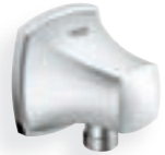
27 970 000 Wandanschlussbogen ● ●