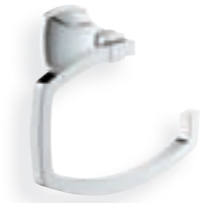
40 625 000 WC-Papierhalter ● ●