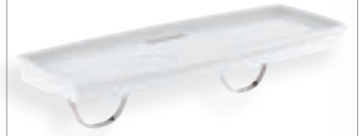
18 651 000 GROHE EasyReach™ Ablage