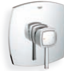
19 932 000 + 35 501 000 Einhand-Brausebatterie ● ●