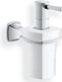
40 627 000 Halter + Seifenspender ● ●