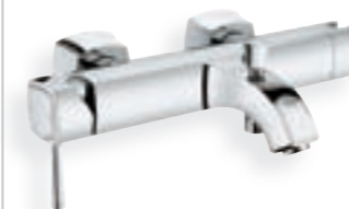
23 317 000 Einhand-Wannenbatterie ● ●