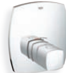
19 941 000 + 35 500 000 Thermostat-Zentralbatterie ● ●