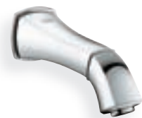
13 341 000 Wannenauslauf ● ●