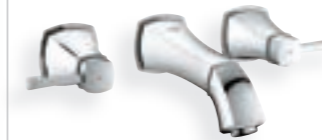
20 414 000 + 29 025 000 3-Loch-Waschtischbatterie Wandmontage Ausladung 177 mm ● ● 20 415 000 + 29 025 000 Ausladung 234 mm ● ●