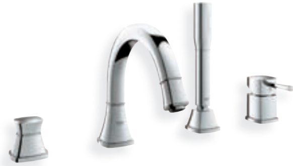
19 936 000 + 29 037 000 4-Loch-Wannen-Kombination ● ●