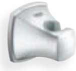
27 969 000 Handbrausehalter ● ●