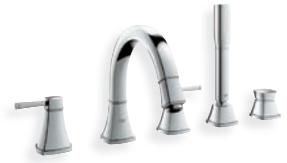
19 919 000 + 29 037 000 5-Loch-Wannen-Kombination ● ●