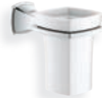
40 626 000 Halter + Mundspülglass ● ●