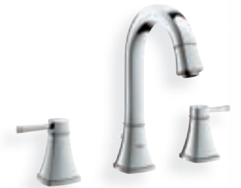
20 389 000 3-Loch Waschtischbatterie hoher Auslauf ● ●