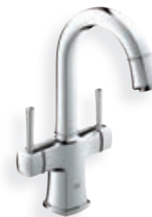
21 107 000 Waschtisch-Einlochbatterie ● ●