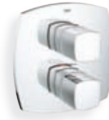
19 934 000 + 35 500 000 Thermostat-Brausebatterie ● ● 19 937 000 + 35 500 000 Thermostat-Brausebatterie mit 2-Wege-Umstellung ● ●