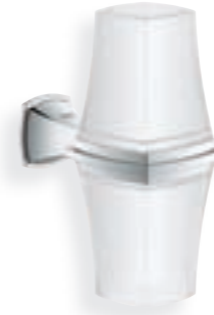
40 661 000 Leuchte ● ●