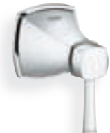
19 944 000 + 29 032 000 UP-Ventil Oberbau ● ●