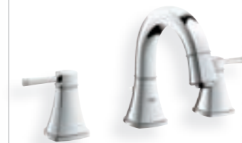
20 417 000 3-Loch Waschtischbatterie ● ●