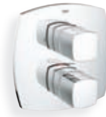
19 948 000 + 35 500 000 Thermostat-Wannenbatterie mit 2-Wege-Umstellung ● ●