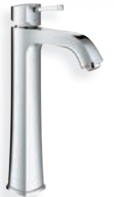
23 313 000 Einhand-Waschtischbatterie für freistehende Waschsüsseln ● ●