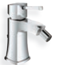
23 315 000 Einhand-Bidetbatterie ● ●