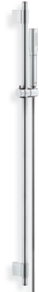
26 038 000 Brausestangenset 900 mm ● ●