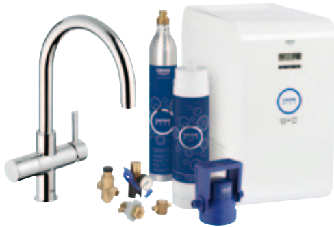
31 323 001 / 31 323 DC1 GROHE Blue® Starter Kit umfasst: Einhand-Spültischbatterie mit Filterfunktion, Wasserfilter komplett mit Filterkopf, Kühler, Karbonisierer