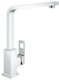
31 255 000 / 31 255 DC0 Eurocube Einhand-Spültischbatterie mit schwenkbarem Rohrauslauf