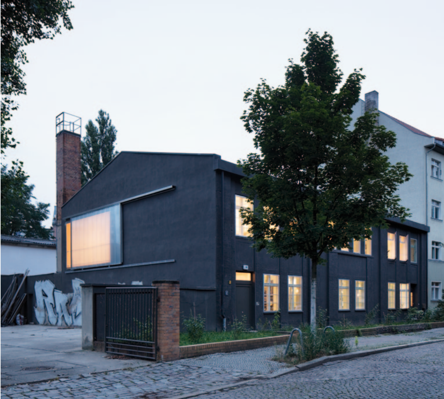
Von außen ließ der Künstler sein Haus dunkelgrau streichen und legte großen Wert darauf, die Graffitis an der Stirnseite des Gebäudes zu erhalten

Idee. Aus 18 kleinteiligen Büros im Erdgeschoss wurde das Atelier mit einem seitlichen Anbau. Die Wände und die freigelegte Kappendecke sind in Weiß gehalten, ein kleines Bad wurde unauffällig in die Mitte des Raums eingeschoben. Großzügige Fenster bringen das gewünschte Licht in den Anbau.