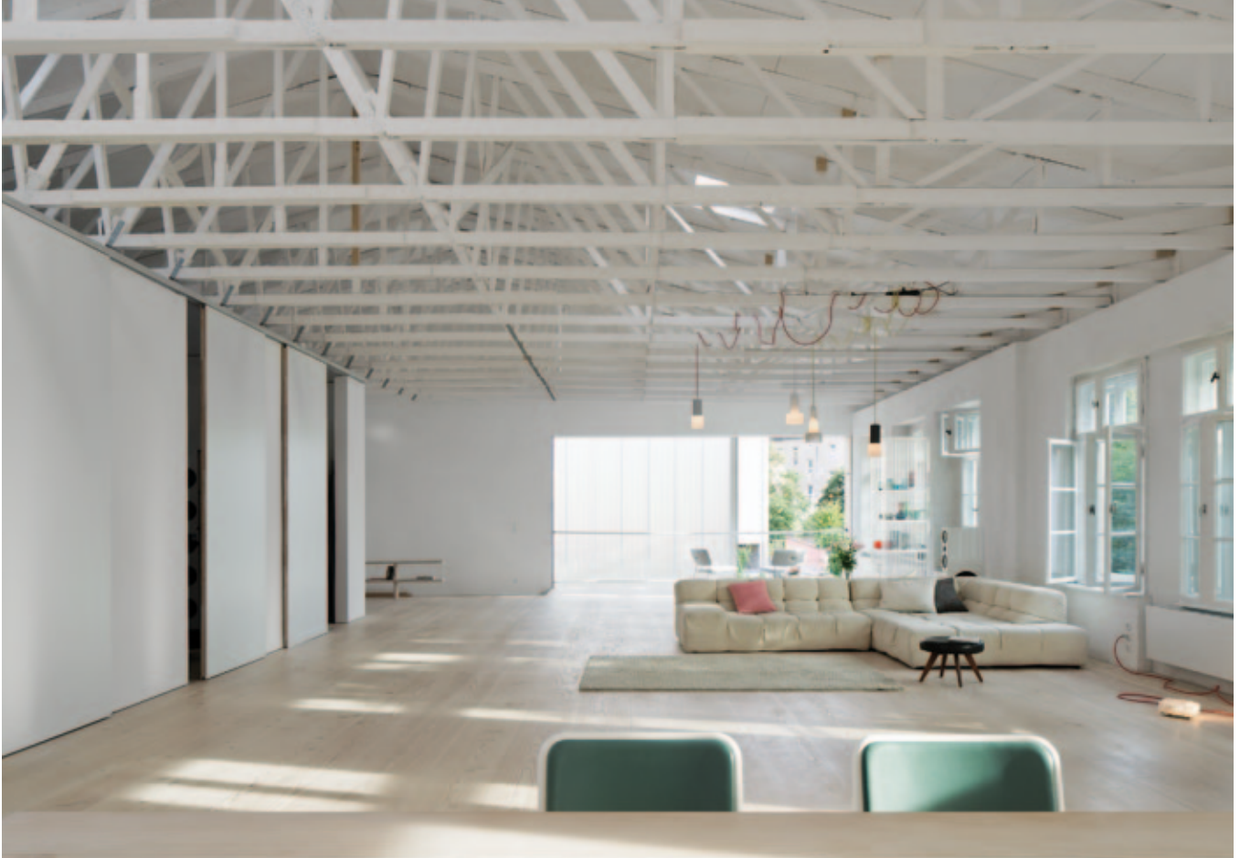
Die Wohnfläche im Obergeschoss mit Blick auf den Südostgiebel

Küche aus schlichten weißen Kuben. Auch die freigelegte Fachwerkbinderkonstruktion macht einiges her, weiß gestrichen, gibt sie der großzügigen Wohnfläche einen ganz eigenen Rhythmus.