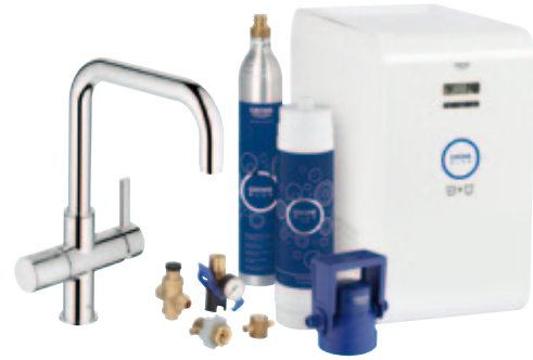
31 324 001 / 31 324 DC1 GROHE Blue® Starter Kit umfasst: Einhand-Spültischbatterie mit Filterfunktion, Wasserfilter komplett mit Filterkopf, Kühler und Karbonisierer