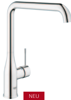
30 269 000 / 30 269 DC0 Essence Einhand-Spültischbatterie mit schwenkbarem Rohrauslauf