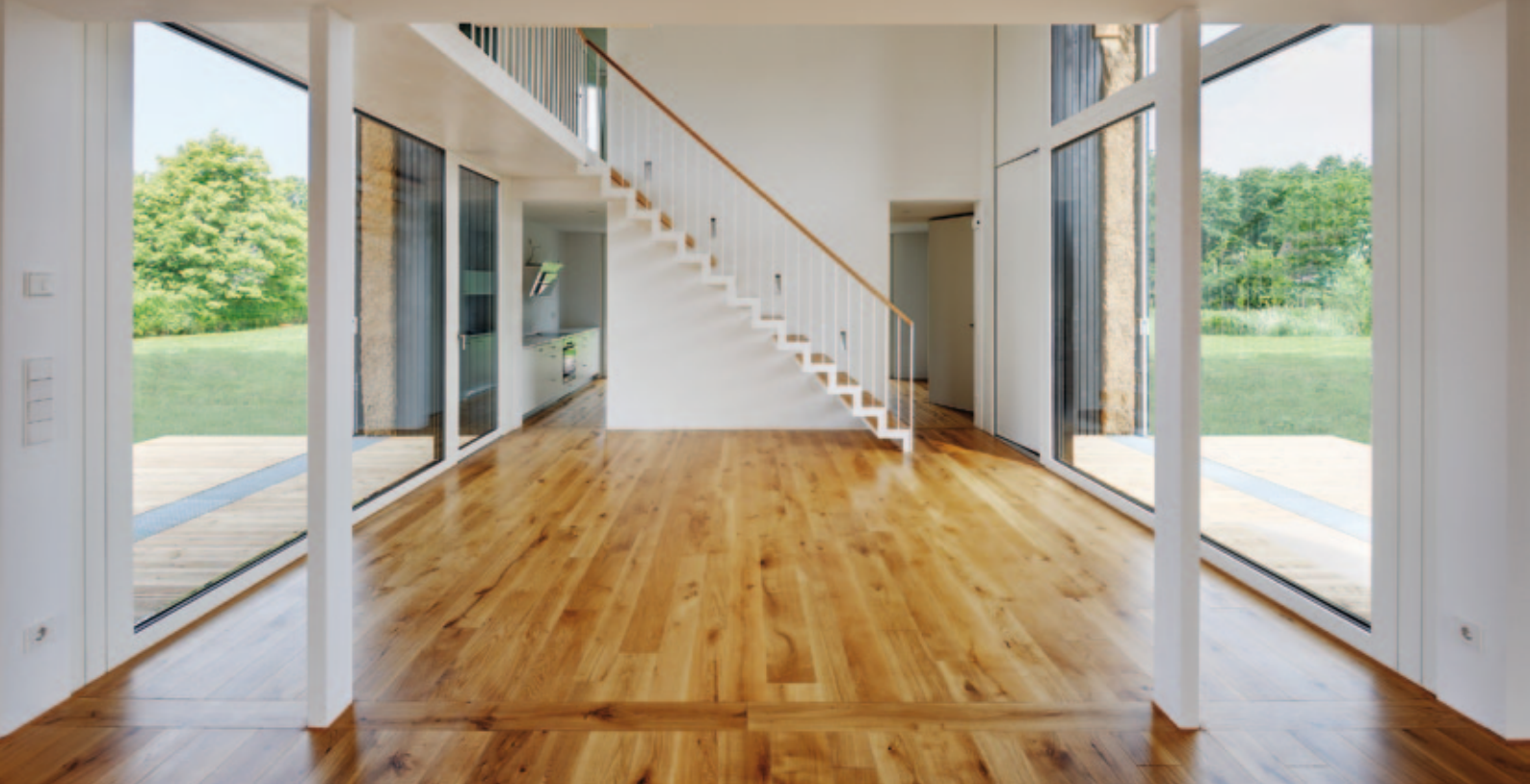
Die Häuser des Scheunen Trios wurden in mehrere abgeschlossene Volumen geteilt: Luftraum mit Treppe, Essbereich, Wohnraum und Schlafzimmer mit separaten Bädern und Ankleidebereichen in den Obergeschossen