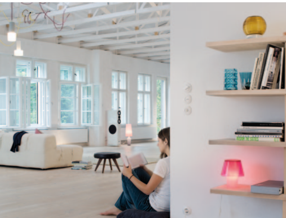
Gemütliche Rückzugsorte strukturieren die großzügigen Flächen

Seit 2004 stand das Gebäude dann leer. 460 m 2 Nutzfläche auf zwei Etagen, eine Terrasse, ein kleiner nicht einsehbarer Innenhof, dazu angrenzende Freiflächen und ein benachbarter Parkplatz, umfassen das neue Zuhause. Das Licht, das der Künstler sich nicht verbauen lassen will, spielt im Inneren eine übergeordnete Rolle. Hell, großzügig und leicht soll alles sein. Bei ihren Planungen orientierten sich Augustin und Frank am früheren Zustand des Gebäudes und haben durch den Abriss der Trennwände und Unterdecken zwei klassische große Räume freigelegt, die Fabriketage und die Scheune. Ein Raum zum Arbeiten, ein Raum zum Wohnen. Alle neuen Konstruktionen und Materialien unterstützen diese einfache