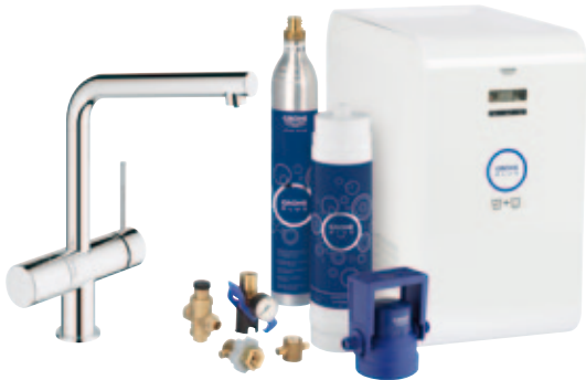
31 347 002 / 31 347 DC2 GROHE Blue® Minta Starter Kit umfasst: Einhand-Spültischbatterie mit Filterfunktion, Wasserfilter komplett mit Filterkopf, Kühler und Karbonisierer