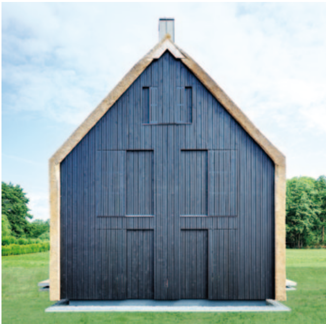
Scheunen Trio: Die Giebelseiten mit Ausrichtung nach Norden und zur Straße wurden mit einer Lochfassade ausgebildet und mit verschließbaren Schiebeläden als Sicht-, Sonnen und Insektenschutz versehen