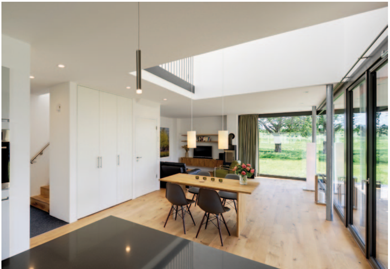
Auch im Ferienhausduo auf Rügen achteten die Architekten auf zeitloses Design und natürliche Materialien

Uns interessierte die schmucklose Gestalt alter Scheunen und Nebengebäude und die damit verbundene Konzentration auf das Wesentliche: Beim Wohnen geht es um Raum und Licht, um Sonne und Schatten, Offenheit und Schutz, Außen und Innen. Diese wesentlichen Merkmale haben wir mit dem