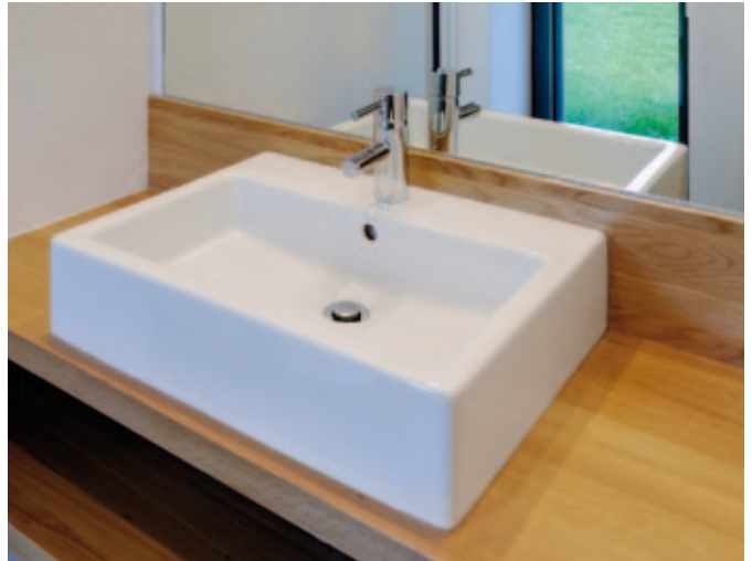
Das minimalistische Design der Armaturenlinie Essence betont die optische Balance im Ferienhausduo

Materialien müssen altern dürfen. Durch diese Veränderung bekommen sie einen Ausdruck und der Bau einen Charakter. Für uns sind Haptik und Werthaltigkeit der Baustoffe wichtige Entscheidungskriterien. Die Oberflächen und Farben der Materialien erzählen dabei die Geschichte eines Hauses, dessen Intention und Ortverbundenheit weiter. Natürliche Materialien besitzen die Qualität von Langlebigkeit, guter Verarbeitbarkeit und einer zeitlosen Erscheinung, die uns sowohl in Hinblick auf die ästhetische Gestalt, als auch die Baukonstruktion besonders wichtig ist.