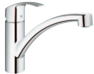
33 281 002 Eurosmart Einhand-Spültischbatterie mit flachem Auslauf