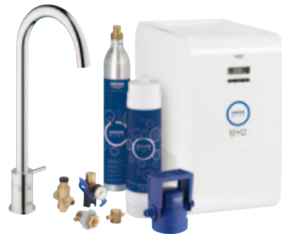
31 302 001 / 31 302 DC1 GROHE Blue® Mono Starter Kit umfasst: Einhand-Spültischbatterie mit Filterfunktion, Wasserfilter komplett mit Filterkopf, Kühler und Karbonisierer