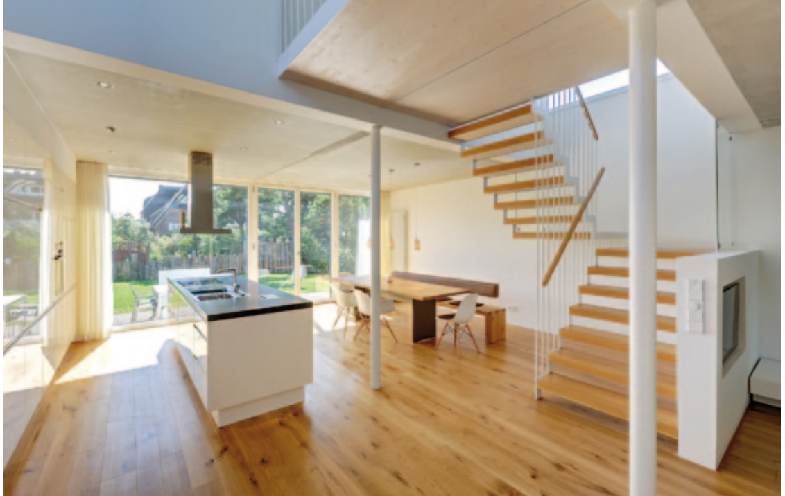
Der zentrale Wohnraum des traditionellen Drempelhauses Fischland II öffnet sich über eine freizügige Glasfläche nach außen und über eine filigrane Treppe ins Obergeschoss