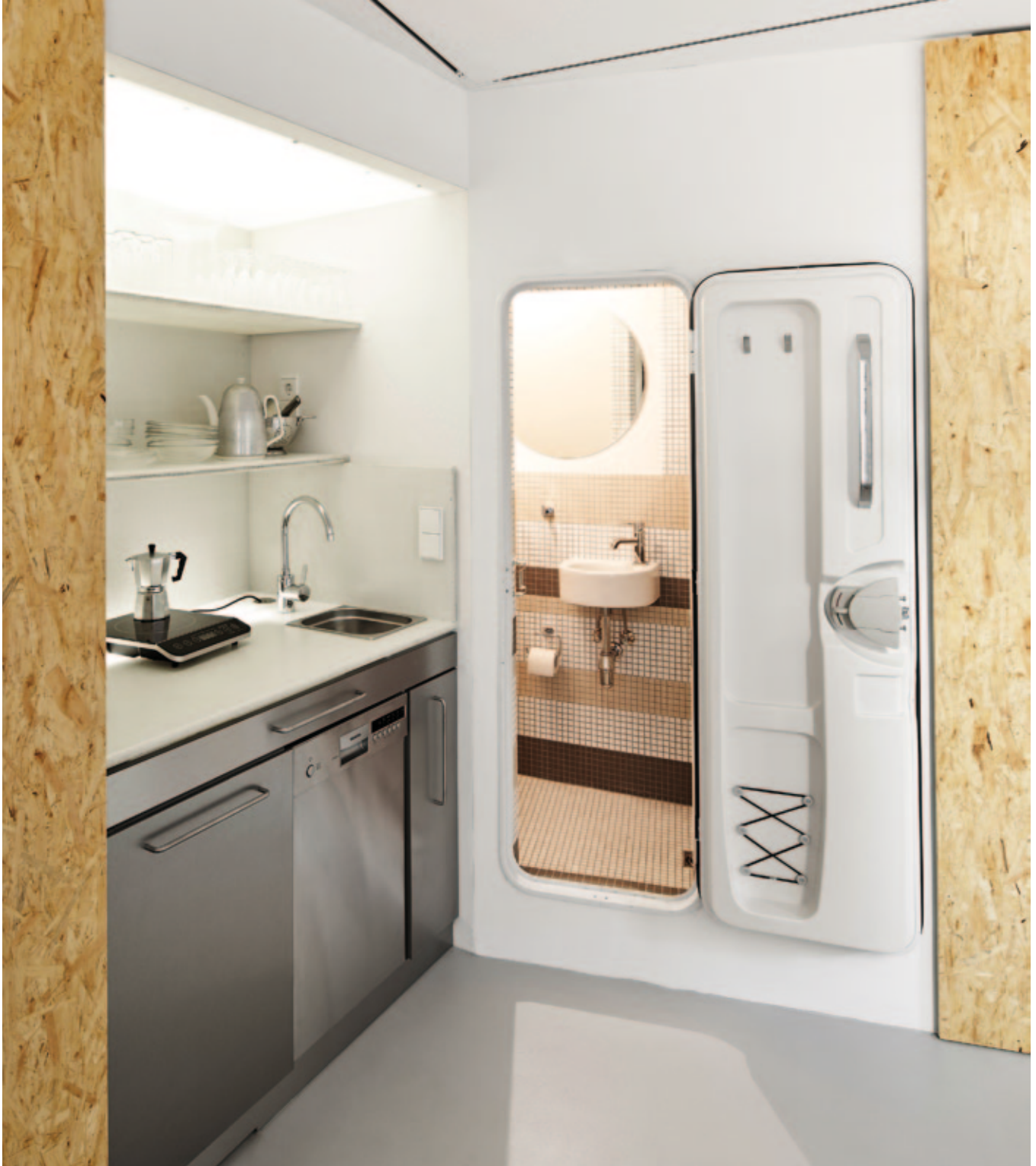
Übergang von der Küche zum Bad – das Bad ist klein und reduziert, aber platzoptimiert