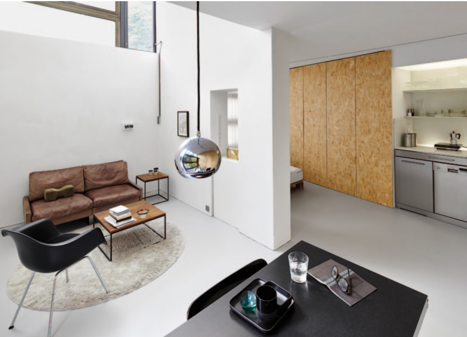
Die Aufenthaltsbereiche Wohnen – Essen – Schlafen sind an den gut belichteten Stellen angeordnet; die dienenden Funktionen Küche und Sanitär im Inneren

Vielfalt bedeuten kann – viel gefühlter Raum durch Funktionsüberlagerung und komprimierte Funktionen.