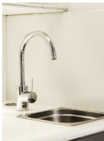
Geringer Wasser- und Energieverbrauch sowie leichte Bedienung kennzeichnen sowohl die Waschtischarmatur Allure (links) als auch die Küchenversion der GROHE Eurosmart Cosmopolitan (rechts).