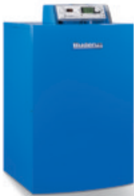
Gas-Brennwert-Heizkessel Logano plus GB202

Bei diesem Gas-Brennwert-Heizkessel kommt ein Plus zum anderen. Und das nicht nur in Sachen Energieersparnis. Denn dank seiner besonders kompakten Abmessungen sparen Sie sogar noch mehr: und zwar jede Menge Platz. Wer so viel spart, muss einfach belohnt werden: mit geringem Montageaufwand – überall da, wo Sie Ihren alten, energieverwendenden atmosphärischen Gas-Heizkessel einfach ersetzen wollen.