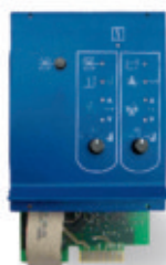
Modul FM 444

Beide Heizkessel sind robust, pflegeleicht und einfach zu installieren. Als großer Systemanbieter hat Buderus neben den passenden Pufferspeichern auch die perfekte Steuerung: Das Modul FM444 koordiniert mit der Regelung Logamatic 4000 konventionelle und alternative Wärmeerzeugung auf optimale Art und regelt auch die Betriebsbedingungen des Holzessels.