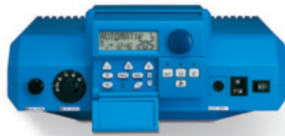
Das Regelgerät Logamatic 2107 steuert die gewünschten Raum- und Wassertemperaturen auf höchst wirtschaftliche Art.

Der Logano G125 BE Eco beruht auf einem Heizkessel-Konzept, das sich in Vorgängermodellen bereits millionenfach zuverlässig bewährt hat. Schneller und einfacher kann man gar nicht modernisieren: Die Anschlüsse sind kompatibel zu älteren Generationen für ein zügiges Verbinden mit vorhandenen Rohren – bei vergleichsweise geringen