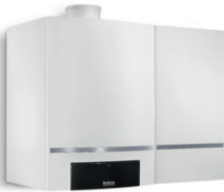
Logamax plus GB162 mit 40-Liter-Schichtenladespeicher

Der Logamax plus GB162 spart nicht nur eine Menge Energie, sondern auch Platz. Sein überaus kompaktes Format ist ein Riesenvorteil für Sie, denn jeder gesparte Zentimeter bringt umso mehr Freiheit bei der Wahl des Aufstellungs-ortes. Das Gerät passt in viele Nischen und Ecken und überzeugt durch denkbar einfache Montage. Und das besondere Plus: Auf Wunsch verwöhnt Sie der Logamax plus GB162 auch noch mit sehr hohem Warmwasserkomfort.