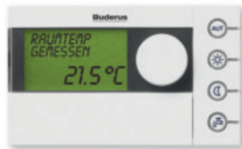
Bedieneinheit Logamatic RC35

Kombinieren, erweitern, modernisieren: Mit dem Logamax plus GB162 eröffnen sich Ihnen alle Möglichkeiten. Denn er ist ein perfekter Teamplayer, wenn es etwa darum geht, die Kraft der Sonne mit einzubeziehen. Oder Festbrennstoffe wie Holz oder Pellets. Alles ist schon so gut wie geregelt.