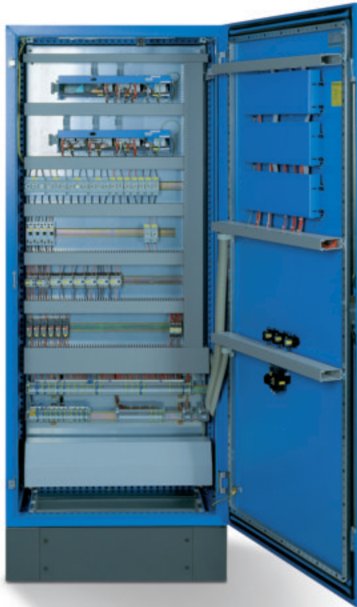
Schalterschranksystem Logamatic 4411