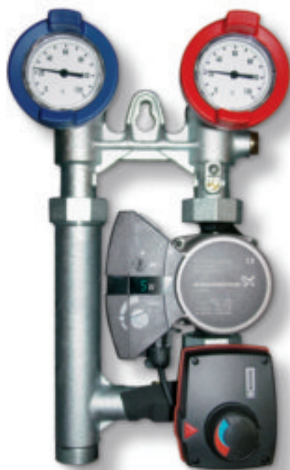
Heizkreis-Anschluss-Set HSM-E plus

Sparen selbst bei kletternden Energiepreisen? Buderus macht's möglich. Und das nicht nur mit hocheffizienten Heizkesseln, sondern auch mit Zubehörteilen, die in puncto Energieverbrauch so richtig tiefstapeln. Wie die Heizkreis-Anschluss-Sets mit der Stromsparpumpe E plus, erhältlich in den Ausführungen HS-E plus für Heizkreise ohne Mischer und HSM-E plus für Heizkreise mit Mischer.