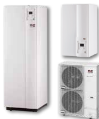
LWP HP/LWPK HP