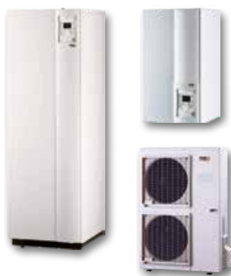
LWP HT/LWPK HT