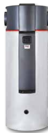
WPA 450 ECO