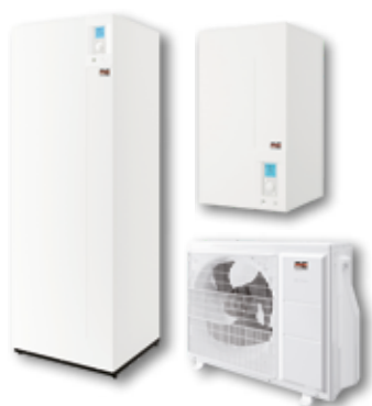
LWP AI/LWPK AI