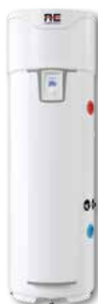
Explorer EVO 2