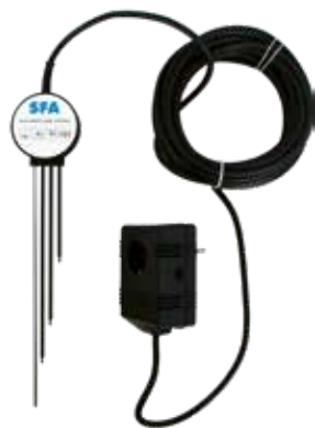
Elektronische Niveausteuerng optional für SANIPUDDLE (siehe S. 108)