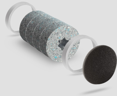
Built-in device ALD-S

Products and illustrations may vary slightly. Due to continuous product development and/or several suppliers e.g. for raw materials, colours, among other things, may vary slightly (not for visible parts) or be shown differently in brochures.